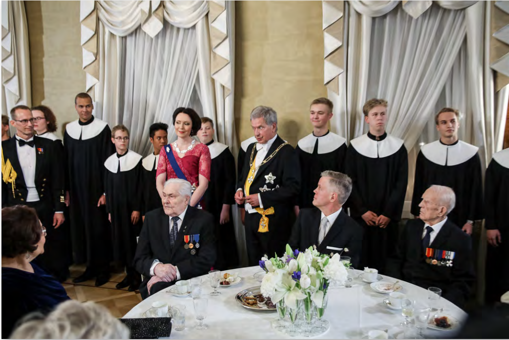
Tasavallan presidentti Sauli Niinistö ja tohtori Jenni Haukio Cantores Minores -kuoron koko toiminnan pysyvät suojelijat 2012-2024